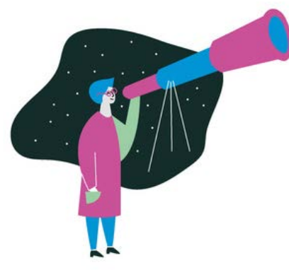
АСТРОНОМИЯ 14 октября 5-11 классы