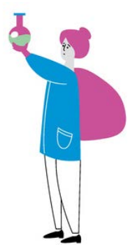
ХИМИЯ 12 октября 7-11 классы