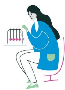
ФИЗИКА 28 сентября 7-11 классы