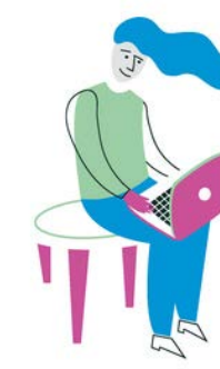
ИНФОРМАТИКА 26 октября 5-11 классы