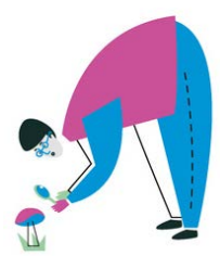
БИОЛОГИЯ 5 октября 5-11 классы