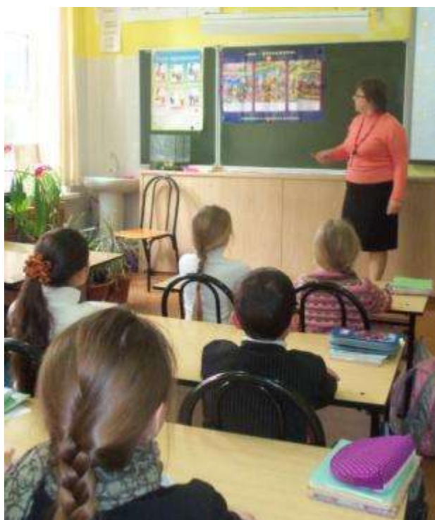
Занятие в отряде ЮИД