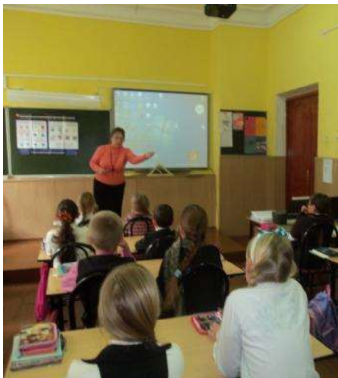
Викторина «Безопасное движение»