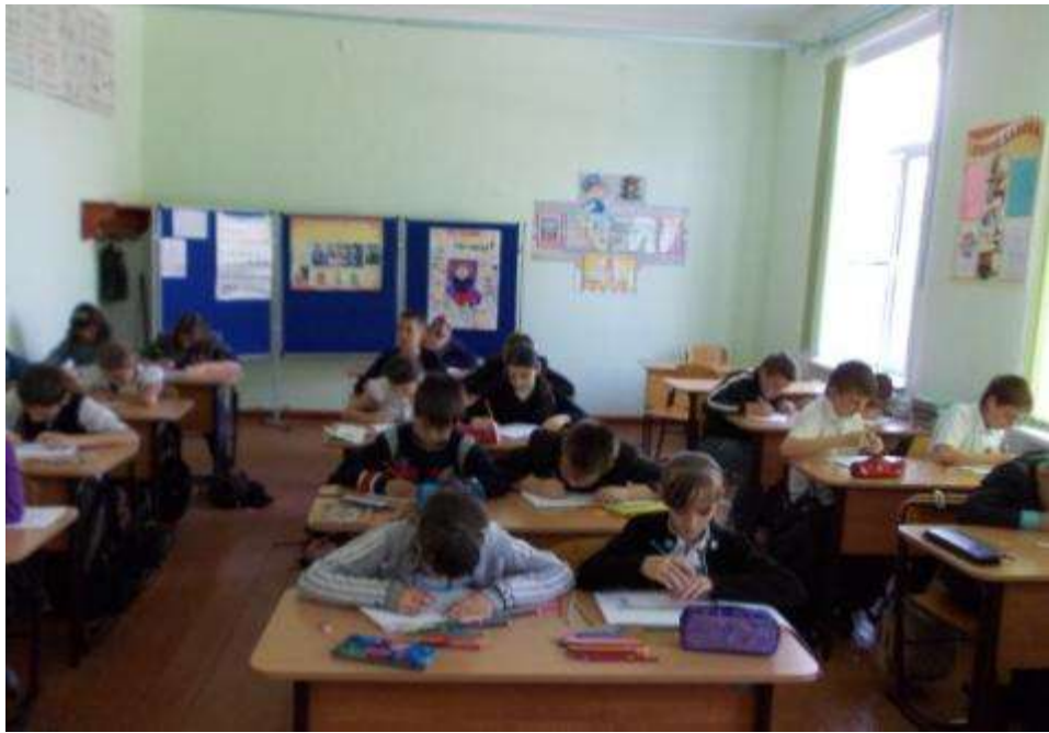
Рисуем к конкурсу «Мы участники дорожного движения»