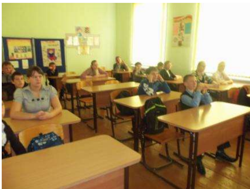
Классный час в 9 классе