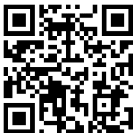
Фото и видео музея. - Текст, изображение: электронные // Темрюкский историко-археологический музей. – Темрюк. - Обновляется в течении суток. – URL: https://www.culture.ru/institutes/10583/temryukskii-istoriko-arkheologicheskii-muzei (дата обращения: 12.05.2022.).

14. Темрюкский историко-археологический музей. – Темрюк. - Обновляется в течении суток. – URL: https://темрюк-музей.рф/ (дата обращения: 12.05.2022.). – Текст, изображение: электронные.